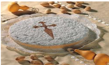
Tarta de Almendra Casera