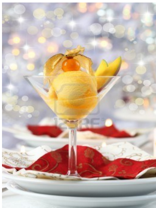
Sorbete de Mango