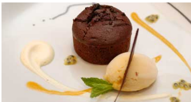
Coulant de Chocolate con Helado