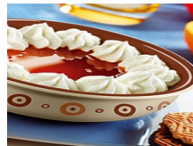
Tarrina de Whisky