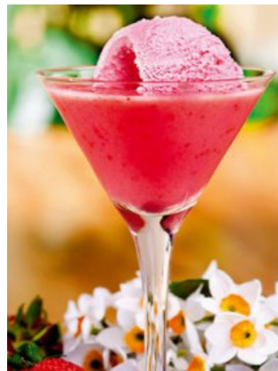
Sorbete de Frambuesa